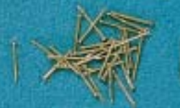
C 150; C 152 L. 10 mm, Ø 0,5 mm