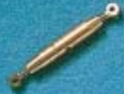
A 218 - L. 13 mm A 220 - L. 20 mm A 222 - L. 25 mm A 224 - L. 30 mm