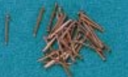
C 154 - L. 10 mm, Ø 0,5 mm

A 90; A 92; A 94; A 95 Anelli in ottone Ring • Anneau • Ring