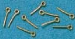
A 98 - Ø 3 mm, L. 12 mm