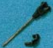
A 230 - L. 30 mm